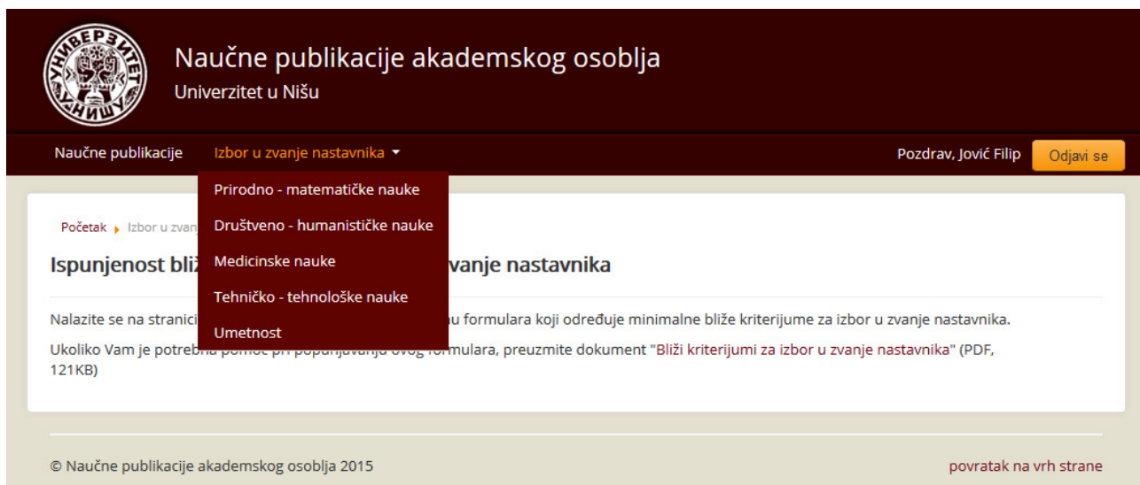
slika 1 - osnovni meni

Alat se nalazi na adresi www.npao.ni.ac.rs i pristup alatu imaju svi registrovani korisnici ovog portala. U horizontalnom meniju na vrhu se, nakon logovanja na sistem, pojavljuju opcije koje korisnika vode najpre do odgovarajućeg naučno stručnog veća. Po izboru odgovarajućeg veća, na stranici koja se otvori se nalaze opcije vezane za to veće (za sva veća stranice isto izgledaju po formi), kao i kratko uputstvo u dnu strane kako se krećete po opcijama i čemu služe.