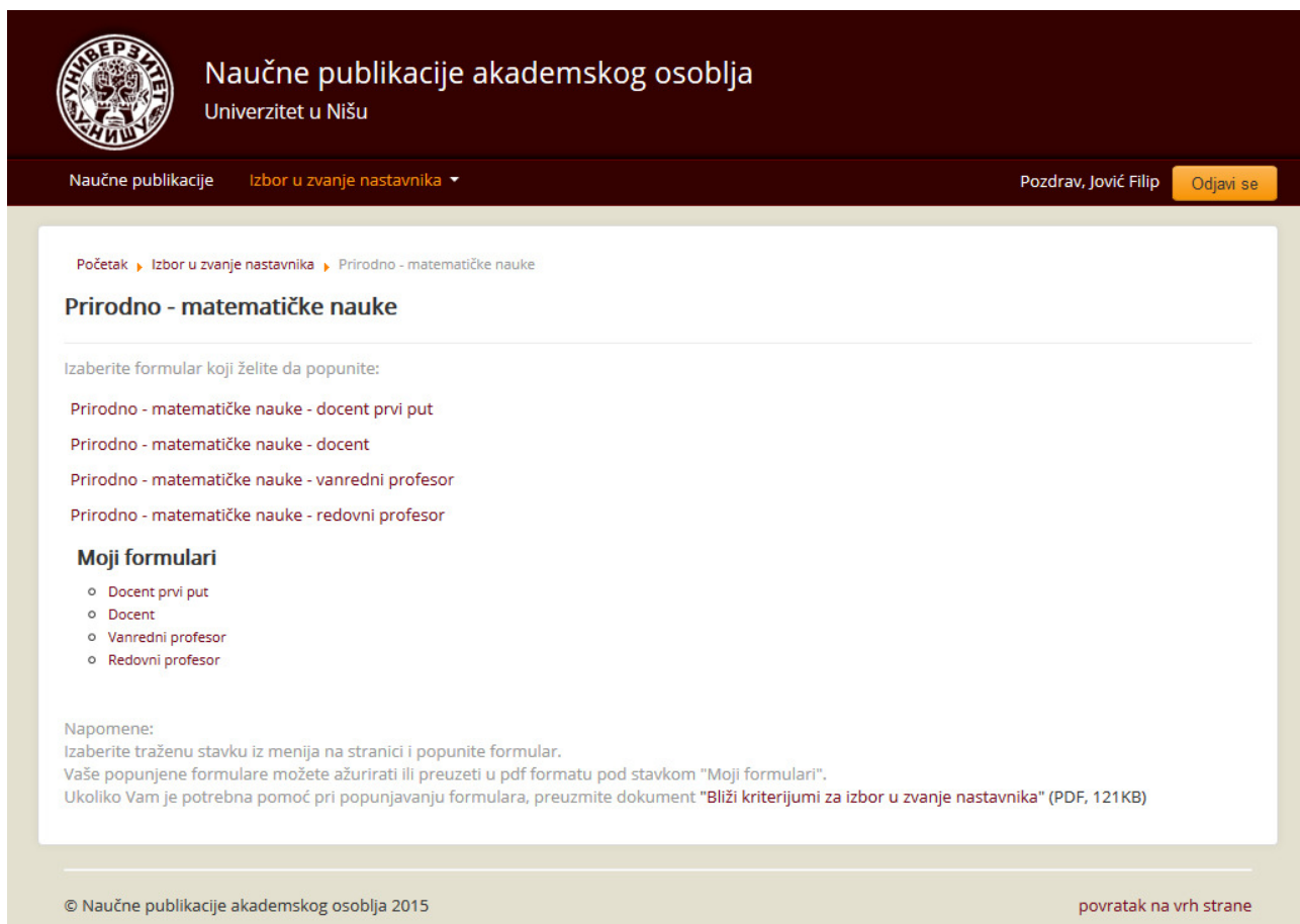
slika 2 - primer izbora stranice Prirodno matematičke nauke iz menija