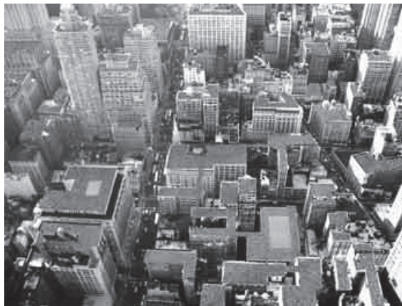
Slika 4. Ozelenjene krovne površine u Čikagu, SAD [16]

Na osnovu ispunjenih uslova za izvođenje zelenih krovova na izgrađenim objektima, mogu se formirati i čitavi blokovi zgrada sa vegetacionim slojem na vrhu. Takav slučaj je grad Čikago, SAD, u kome je 24000 ha ravnih krovnih površina ozelenjeno u cilju poboljšanja kvaliteta životne sredine u gusto izgrađenom urbanom tkivu [16].