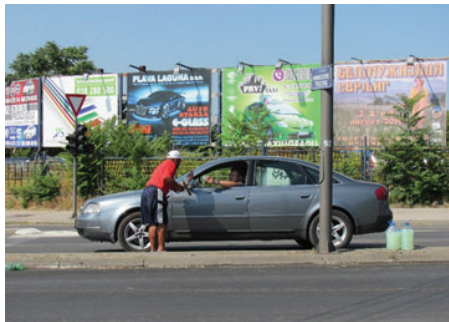
Slika 26: Bude i papirna novčanica (foto: D. Todorović, 2019)