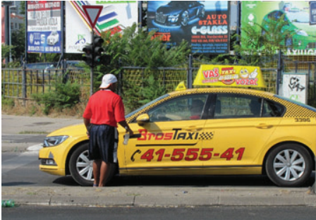
Slika 18: Taksi preskačemo

Tomino socijalni kapital jedino su kontakti sa vozačima u koloni pred svetlosnim simbolom zabrane kretanja. Dokaz da je prepoznatljivo lice sa emocijama – ne bezlični prosjak, klošar il' probisvet. A šoferi su raznih sorti: