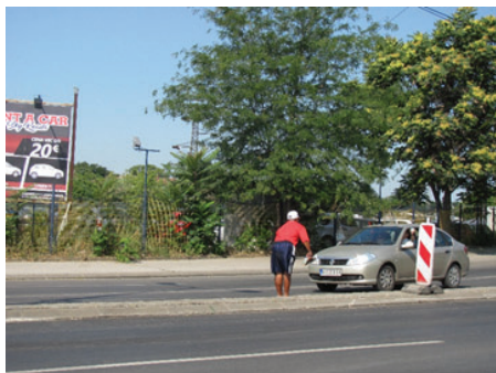
Slika 27: A uzme nešto i u pokretu