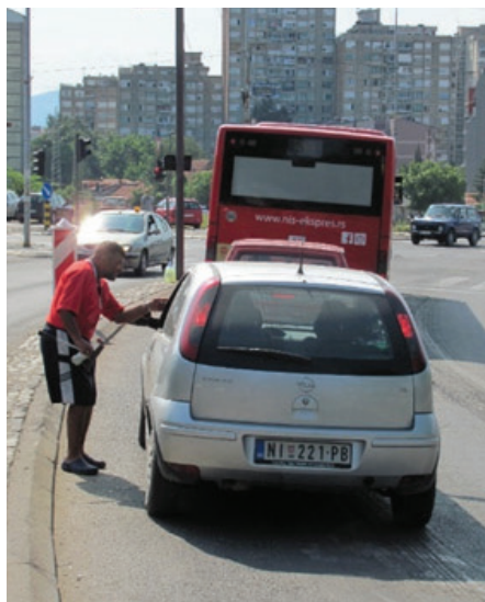
Slika 21: Pozdrav mališanima u autu