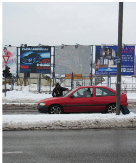
Slika 15: Brzo – da se drajver ne predomisli

Samo su krajnji vremenski uslovi (mećava, provala oblaka i olujni vetar) ili