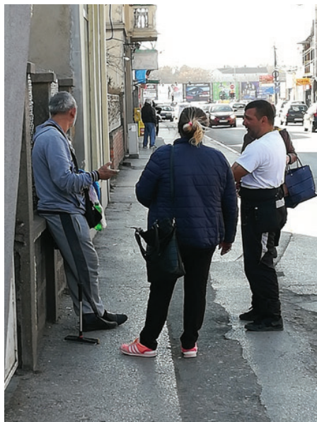
Slika 11: Sa poznanicima iz Doma gluhih