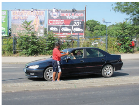
Slika 13: Predah uz ćaskanje sa šoferima