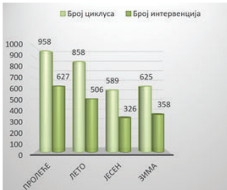
Grafikon 3. Broj ciklusa i intervencija po godišnjem dobu

1817 puta) honorisali kakvom-takvom crkavicom (grafikon 2).