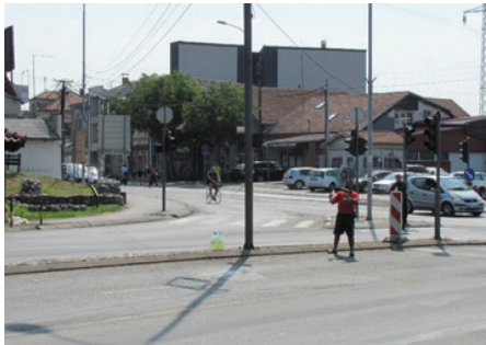
Slika 3: Toma doziva šofere