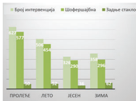
Grafikon 5. Šoferšajbna i zadnje staklo u ukupnom broju intervencija