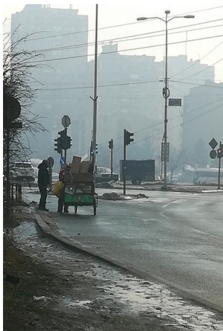
Slika 10: Romski urbani rudari u razgovoru