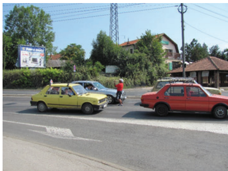
Slika 28: Udari žega i od sunca i od asfalta

naklonio poput kelnera u prestižnoj varoškoj kafani zbog golemog bakšiša.