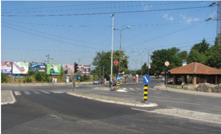
Slika 2: Tomino raskršće