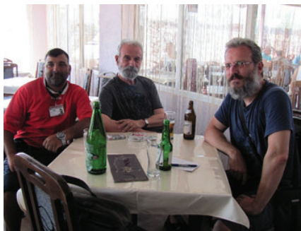
Slika 12: Slučajan susret na buvljaku (foto: D. Todorović, 2019)

proseku po „dvadeseticu“, to iznosi četiri stotine evra koje sada valja raspodeliti na obuhvaćenih 19 dana, što se svodi na kraju na dvadeset evra dnevno. Ne zaboravimo da ih je podjednako naporno „zaraditi“ na usijanom pločniku i dok ledeni vetar probija do kosti. 61 Kao i da će vas neočekivano svakakve boleštine ili vremenske nepogode na kraće ili duže vreme udaljiti sa ulice kao radnog mesta. I šta vam je onda činiti? Gde je ta slamarica iz koje ćete potegnuti novce za crne