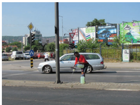
Slika 8: Toma se „naoružava“