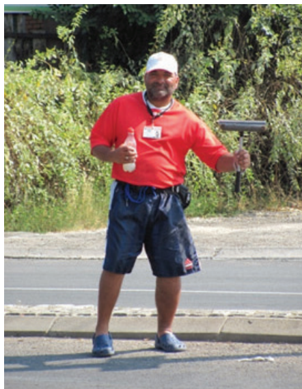
Slika 6: Baš smo zgodni!