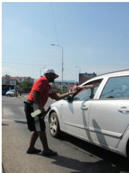
Slika 25: Samo zatečen sitniš (foto: D. Todorović, 2019)

• ljubazan je (sa pristojne udaljenosti upire brisačem u vetrobransko staklo i udeljuje vam osmehe i onda kada ne pristajete da budete deo njegove „igre“), • poznaje klijente (iako mu je „onaj odozgo“ uskratilo moć govora, druželjubivom mimikom nastoji da vam prekrati podužu pauzu između dva raznobojna signala i dobroćudno pozdravlja ostale putnike u autu), • poseduje dozu originalnosti (svojtvenim potezom – dodir stisnutim pesnicama – intimizira se sa starim i novim prolaznicima „njegovim“ raskrsjem).