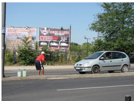
Slika 22: Akrobacija i – eto rabote!

U momentima raspoloženja, posebno kad se proredi promet, Toma Semafordžija na još jedan način pokazuje naklonost vozačima koji se približavaju semaforu. Kako krenu da usporavaju, stane nasred trake i otpočinja se izvođenjem akrobatskih pokreta: prebacuje brisač iz ruke u ruku ili iza leđa skrivenom flašicom nonšalantno izdaleka nabacuje tečnost na vetrobransko staklo (slika 22). Na popodnevnom suncu, umišljao bi da je matador u španskoj koridi, što veštima pokretima kroti metalnu neman. I pridobijao bi simpatije još jednog korisnika njegove skromne usluge.