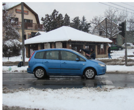
Slika 23: Prvo prednje staklo...