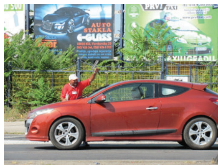
Slika 16: Volim, volim, volim žene...