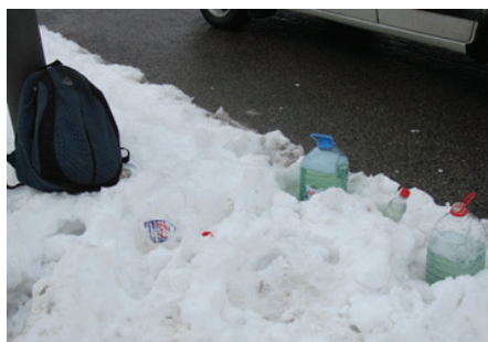
Slika 5: Tomina oprema

Najveća je muka obezbediti vodu za rad, jer u blizini raskrsnice nema javne česme. Izgleda da je snalažljivi Semafordžija pribavio prečutnu saglasnost vlasnika obližnje radnje da u njegovim pomoćnim prostorijama odloži kanister čiju sadržinu svakog jutra uredno puni „dragocenom“ tečnošću. Leti ga posadi kraj signalnog stuba – tada se voda više troši – kada mu služi i kao improvizovano sedalo za kratkotrajnuce predahe u poslu. Najčešće, ipak, poslužuje kao pomereni rezervoar: oko njegovih nogu nalaze se samo vrške pune flaše različitih veličina u koje je dosut deterdžent za pranje suđa. Za druge rekvizite mesta nema; mizanscen je kompletiran (slika 5).