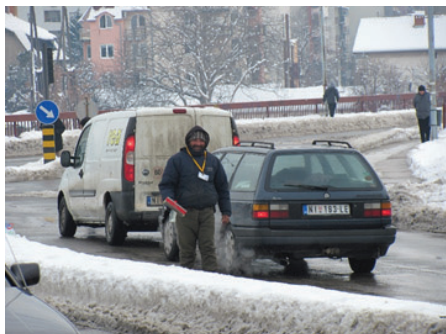
Slika 7: Sneži li, sneži... (foto: D. Todorović, 2018)

s novim. Da, i jevtina platnena torbica uredno okačena o pojas da u nju odlaže prikupljene novčiće.