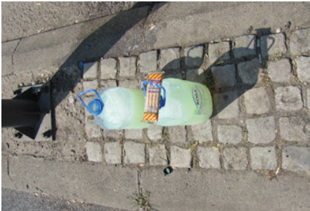
Slika 17: Nema para, al' tu je iće