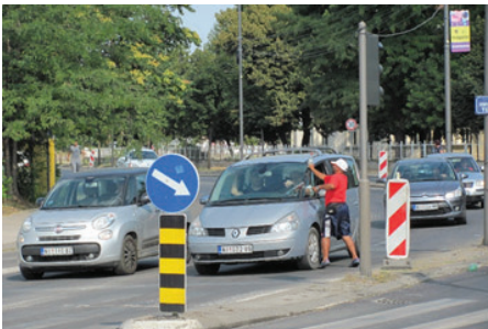
Slika 4: Hitro sam momče!

Toma Semafordžija zarađuje koru hleba na jednoj od najfrekventnijih niških raskrsnica (slika 2). Njegova je radna pozornica pešačko ostrvo, razdelnica po dve saobraćajne trake u suprotnim smerovima. Pola metra široka, duga dvadesetak, omogućuje mu jednolično napred-nazad kretanje u definisanim ciklusima. Reklo bi se, sužene mogućnosti za delovanje. No, nije tako. Kao pred teatarskom publikom, pretvara je naš delatnik čas u binu za monodramu, čas za pantomimu i skeč, ovisno od njegovog trenutnog raspoloženja i inspiracije. Kad od letnje jare baldiše snaga, oslonjen na signalni stub ili povijen nad ovećim kanistrom vode, zaliči nam na kakvog besednika u dramskom komadu o čovekovoј usamljenosti ili nesrećnoj ljudskoj sudbini. Sa druge strane, dok spretno kucka u leptir stakla zaustavljenih auta i zauzetim rukama nastoji da uspostavi prvi kontakt ili, pak, širokim osmehom i dubokim naklonom poziva nervozne vozače da zastanu pred upozoravajućom svetlosnom signalizacijom (slika 3) – kao da prisustvujemo gegovima Šarlo Akrobate, legendarnog komičara nemog filma. A možda će maštovitijem posmatraču, primerenije poslu koji