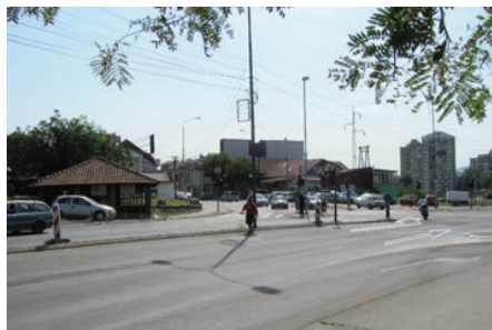
Slika 1: Toma čeka: pravo il' levo

Semafor na Bulevaru „Nikole Tesle“, na raskrsnici kod Jagodin male, regulisao je saobraćaj u dva smera. Leva traka, iz pravca Gradskog polja, skretala je vozače prema Knjaževačkoj ulici i naselju „Durlan“, dok su vozači namerni da stignu u centar grada nastavljali sa pravolinijskim kretanjem (slika 1). Njih je zaustavljalo crveno svetlo, ali sa različitom dužinom trajanja. 49 Pauza za nastavak puta preko glavnog nišavskog mosta iznosila je četrdesetak sekundi: TS je bio u prilici da obavi ne više od jedne „intervencije“ na autu koji stoji; stoga se retko odlučivao za delanje u daljoj traci. Kandidatima za skretanje ulevo čekanje je trajalo mnogo duže, zapravo sve vreme dok je zeleno svetlo omogućavalo kretanje preko mosta. Jedan zaokružen ciklus aktiviranja crvenog svetla trajao je minut i petnaest sekundi, ostavljajući baš toliko vremena i samom TS da dočeka i obiđe automobile zaustavljene u traci bližoj pešačkom ostrvu.