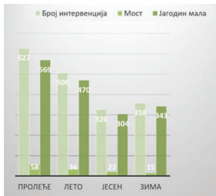
Grafikon 4: Raspodela intervencija prema saobraćajnim pravcima