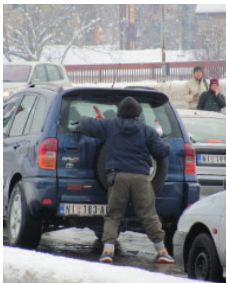
Slika 24: ... a zatim zadnje