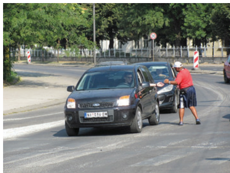
Slika 9: Pozdrav uz šeretski osmeh

U susret „šoferkama“ kreće obično izjutra oko osam, mada zna i da otegne sa dolaskom. Dočekuje ga uz stub semafora naređana ili oko njega nabacana prazna pet ambalaža, kao neka vrsta obeležavanja teritorije i garancija da se niko drugi ne usudi da zaposedne njegovo „kraljevstvo“. Odlaže ranac, prikuplja PVC posude i brže-bolje prelazi ulicu, krećući se prema dvorištu iza martirijuma, od pogleda zaklonjenog živicom i krošnjama drveća. Hitro se vraća, poslaže sada napunjene boce i kreće sa radom (slika 8).