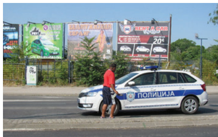
Slika 19: Vlast me pazi