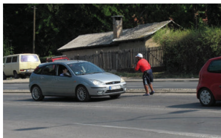
Slika 20: Preuzimamo inicijativu