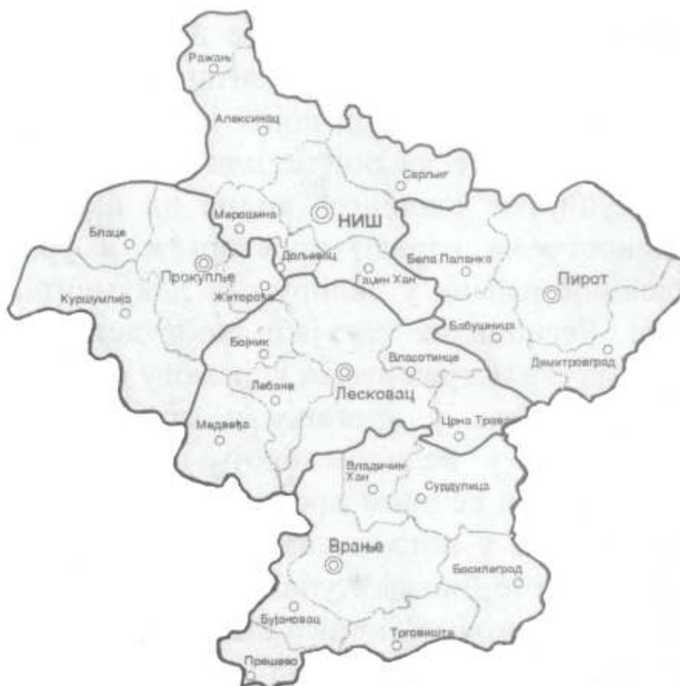
Карта 2. Југоисточна Србија (окрузи и општине)

У стручним комуникацијама засебна културно-религијско-географска територија пет округа са укупно 27 општина – Нишавског (Алексинач, Ражањ,